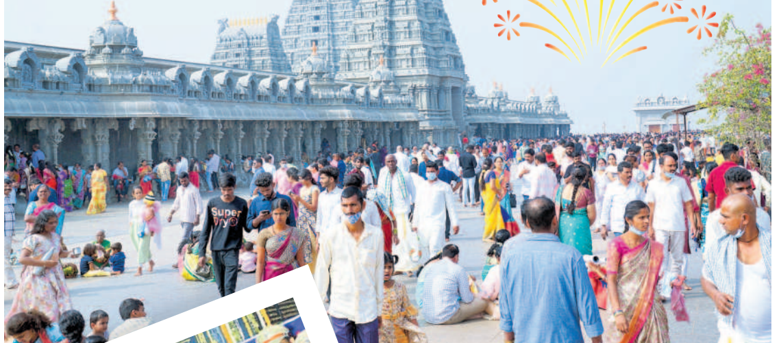
యాదగిరిగుట్ట ఆలయ ఆవరణలో భక్తజనం