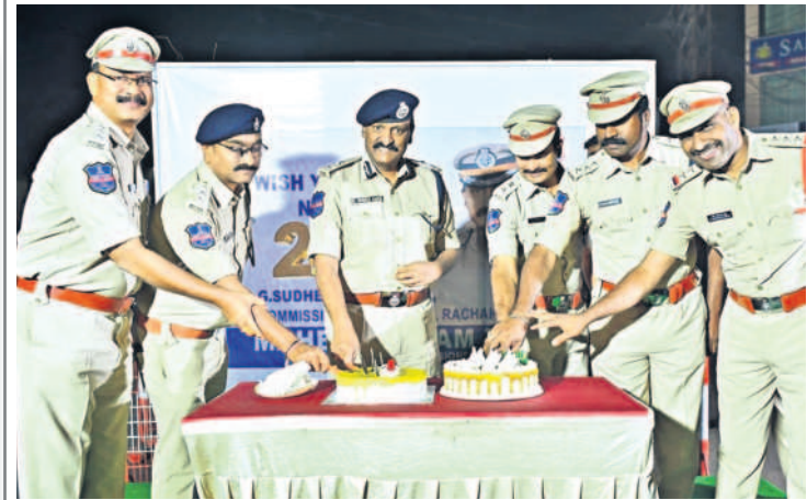
ఇబ్రహీంపట్నం : నూతన సంవత్సరం సందర్భంగా ఇబ్రహీంపట్నంలో కేకేకట్ల చేస్తున్న రావకొండ పోలీస్ కమిషనర్ సుధీర్బాబు