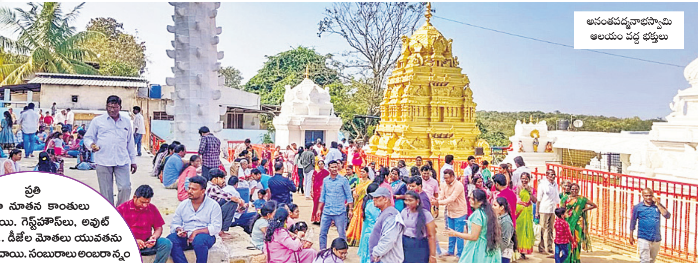
అనంతపద్మనాభస్వామి ఆలయం వద్ద భక్తులు