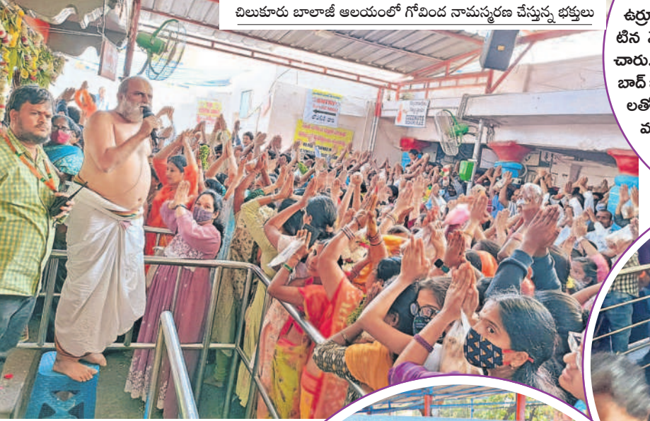
చిలుకూరు బాలాజీ ఆలయంలో గోపం నామస్మారణ చేస్తున్న భక్తులు

ప్రతి ఇంటా నూతన కాంతులు విరజిల్లాయి. గెస్ట్ హౌస్ లు, అవుట్ డోర్ పార్టీలు.. డిజైల్ మోతలు యువతను ఉర్వాతలూగించాయి. సంబురాలు అంబరాన్నంటిన వేళ.. న్యూ ఇయర్ ను ఘనంగా ఆహ్వానించారు. నూతన ఏడాదిని పురస్కరించుకుని వికారాబాద్ జిల్లాలోని ఆలయాల ఉదయం నుంచే భక్తులతో కిటకిటలాడాయి. ఈ ఏడాదిలో అంతా మంచే జరుగాలని దేవుణ్ణు వేడుకున్నారు.