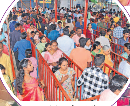
చిలుకూరు బాలాజీ ఆలయంలో క్యూలైన్లలో భక్తులు