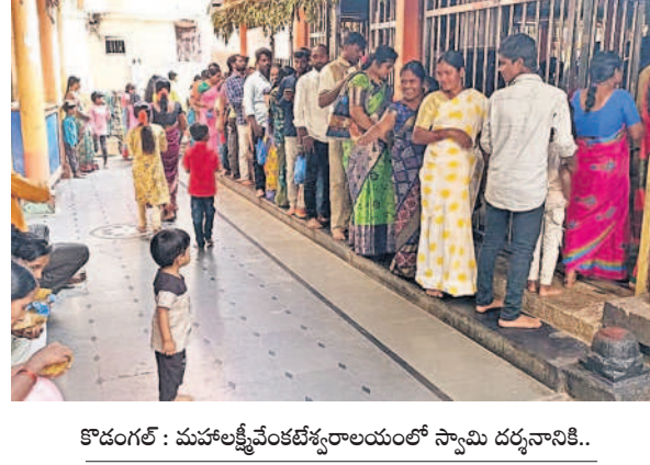
కోడంగల్ : మహాలక్ష్మీవేంకటేశ్వరాలయంలో స్వామి దర్శనానికే..