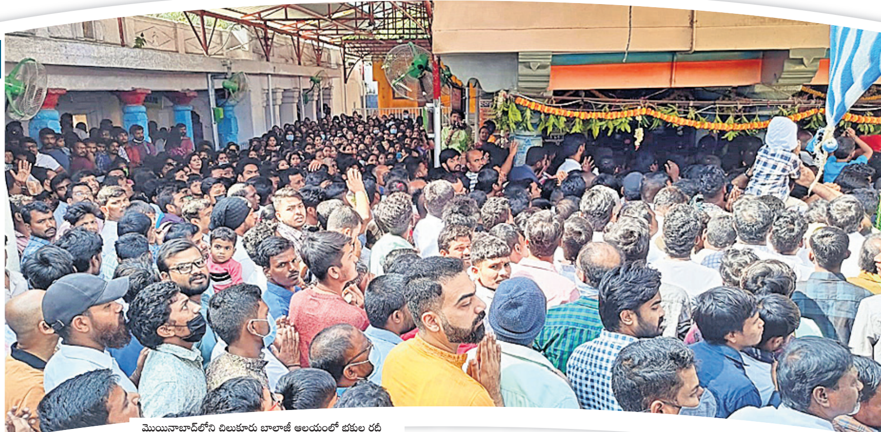
మొయినాబాద్లోని చిలుకూరు బాలాజీ ఆలయంలో భక్తుల రద్దీ

మంది దర్శించుకున్నారని ఆలయ నిర్వాహకులు తెలిపారు. కనకమామిడిలో... నూతన ఏడాది రోజున భగవంతుడిని దర్శించుకుంటే మంచి జరుగుతుందనే నమ్మకంతో భక్తులు సోమవారం కనకమామిడి గ్రామంలో ఉన్న సంఘమేశ్వర(శివాలయం) ఆలయానికి అధికంగా తరలివచ్చారు. సాధారణంగా ప్రతి సోమవారం శివుడిని దర్శించునేందుకు భక్తులు వస్తుంటారు. కానీ నూతన సంవత్సరం.. సోమవారం రెండు కలిసి రావడంతో భక్తులు అధికంగా వచ్చి పరమేశ్వరిని దర్శించుకున్నారు. అర కిలోమీటరు దూరం వరకు భక్తులు క్యూలో నిలుచున్నారు. అదేవిధంగా గ్రామంలోనే కొలువైన వేంకటేశ్వరస్వామిని కూడా భక్తులు దర్శించుకున్నారు.