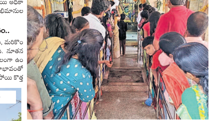
షాద్ నగర్ షాద్ నగర్ పోలీస్ స్టేషన్లో వేంకటేశ్వరాలయంలో స్వామి వారిని దర్శించుకుంటున్న భక్తులు

ఏడాదిలో విద్యారంగంతోపాటు, వర్తక, వ్యాపార, వాణిజ్య, నిర్మాణ రంగాలకు తిరుగు ఉండడన్న ఆత్మవిశ్వాసాన్ని ఆయా వర్గాలు వ్యక్తం చేస్తున్నాయి. అన్నదాతలతోపాటు.. ప్రభుత్వ, ప్రైవేట్ రంగాల ఉద్యోగులు, వివిధ వర్గాల వారు నూతన సంవత్సరంలో సానుకూల పరిస్థితులు నెలకొని మునుపటిలా సాఫీగా సాగుతుందని ఆశాభావం ద్యుక్తాన్ని వ్యక్తం చేస్తున్నారు.