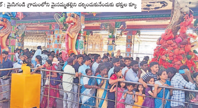
కడపలో : మైసిగండ్డి గ్రామంలోని మైసమ్మతల్లిని దర్శించుకునేందుకు భక్తుల క్యూ