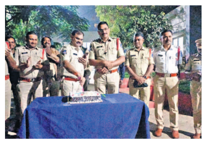
షాద్ నగర్ షాద్ నగర్ పోలీస్ స్టేషన్లో న్యూ ఇయర్ కేకేకట్ల చేస్తున్న ఏసీపీ రంగారావు