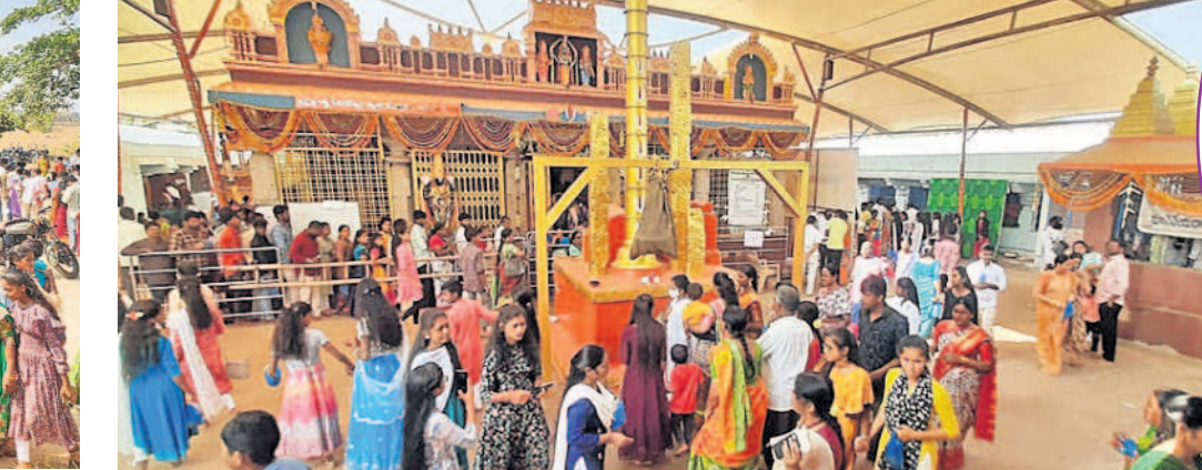
చిలుకూరు బాలాజీ ఆలయంలో క్యూలైన్లలో భక్తులు