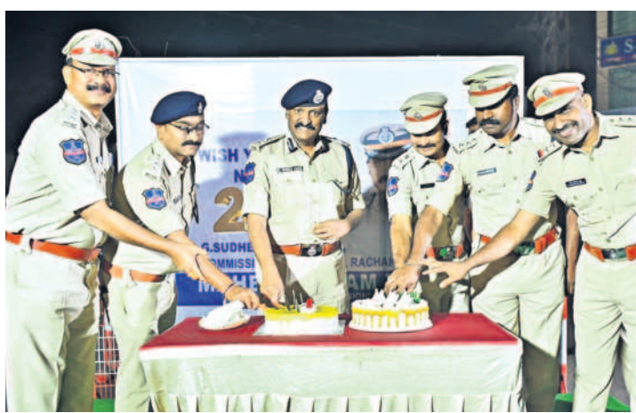
ఇబ్రహీంపట్నం : నూతన సంవత్సరం సందర్భంగా ఇబ్రహీంపట్నంలో కేకేకట్ల చేస్తున్న రావకొండ పోలీస్ కమిషనర్ సుధీర్బాబు