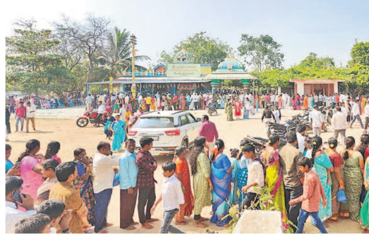
మొయినాబాద్ : కనకమామిడిలోని సంఘమేశ్వర ఆలయం వద్ద బారులుదీరిన భక్తులు