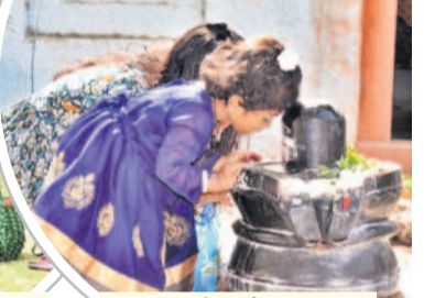
నారాయణపేటలో శివలింగానికి మొక్కుతున్న చిన్నారు