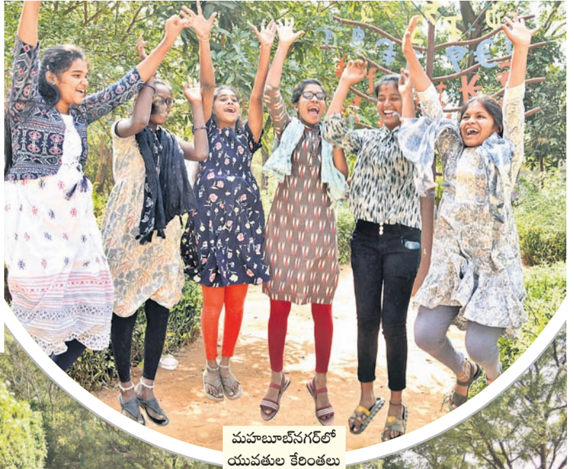
మహబూబ్ నగర్ లో యువకుల కేరింతలు