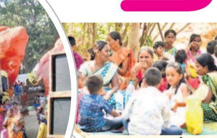
మహబూబ్ నగర్ కేసీఆర్ అర్చన్ పార్కులో భోజనం చేస్తున్న కుటుంబం