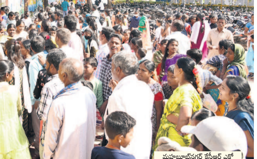
మహబూబ్ నగర్ కేసీఆర్ ఎక్స్ అర్చన్ పార్కు ఎంట్రెన్స్ వద్ద టిక్కెట్ కోసం క్యూలో నిల్చున్న ప్రజలు