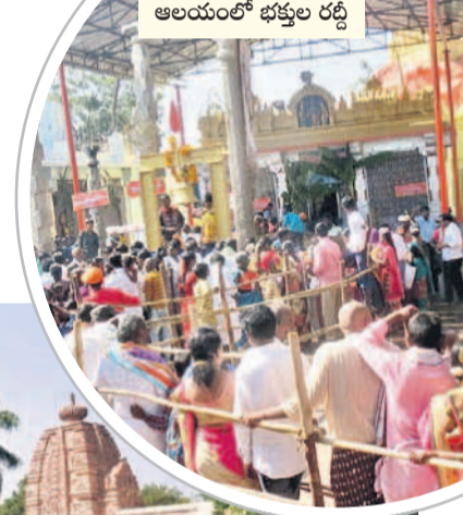
మల్లకల్ వేంకటేశ్వరస్వామి ఆలయంలో భక్తుల రద్దీ