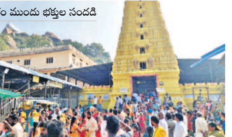
రాజగోపురం ముందు భక్తుల సందడి