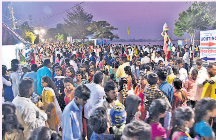
సిద్దిపేట కోమటి చెరువు కట్టపై పట్టణవాసుల సందడి