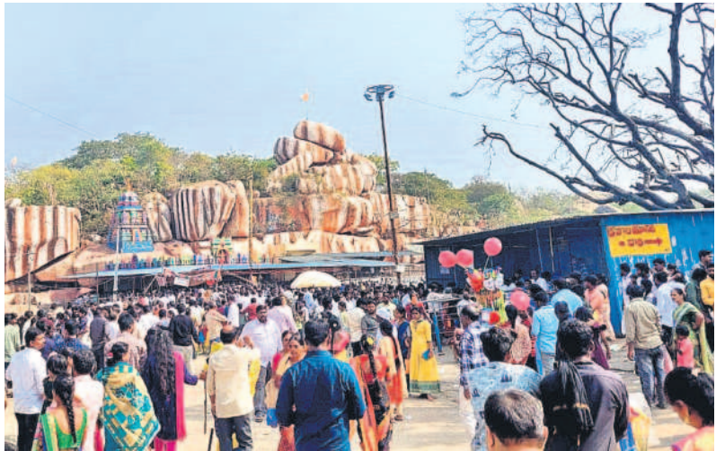
రాజగోపురం వద్ద భక్తుల సందడి