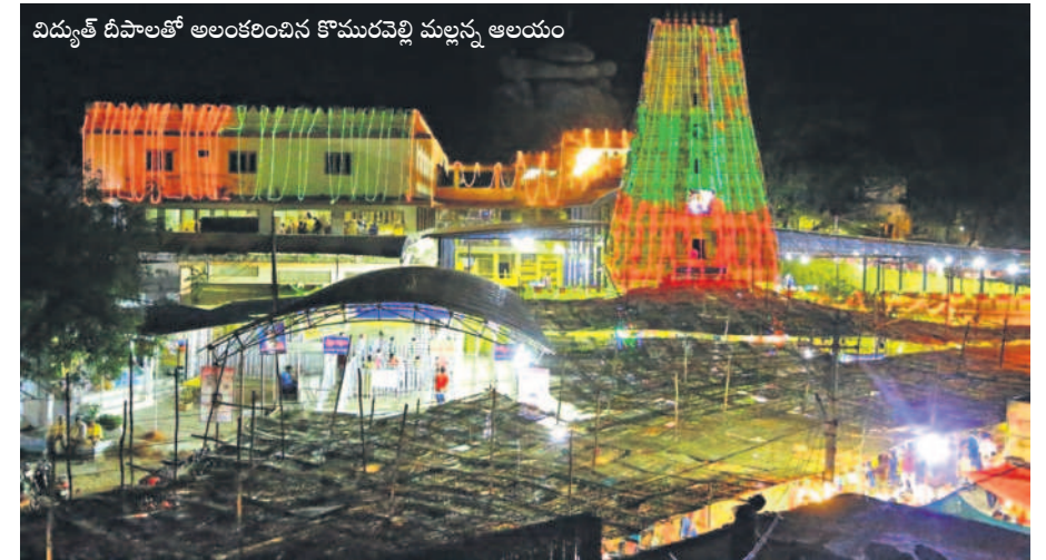
విద్యుత్ దీపాలతో అలంకరించిన కొమురవెల్లి మల్లన్న ఆలయం