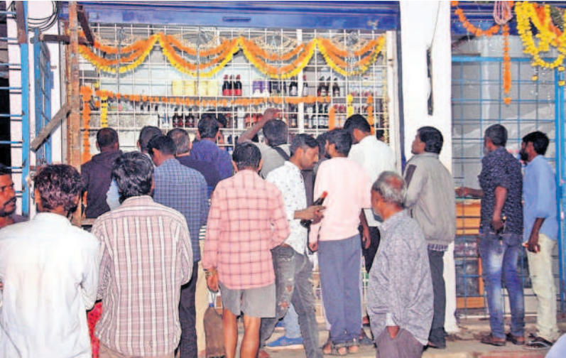
ఆదివారం రాత్రి సంగారెడ్డి పట్టణంలో మద్యం కొనుగోలు చేస్తున్న జనం

డిసెంబర్ లో రూ. 376 కోట్ల మద్యం అమ్మకాలు ఉమ్మడి మెదక్ జిల్లాలో డిసెంబర్ లో రికార్డు స్థాయిలో మద్యం అమ్మకాలు జరిగాయి. 2023 డిసెంబర్ మొత్తంలో ఉమ్మడి మెదక్ జిల్లాలో రూ. 376.65 కోట్ల మద్యం విక్రయించారు. 2022లో రూ. 300.51 కోట్లు, 2023 డిసెంబర్ లో సంగారెడ్డి జిల్లాలో 1,92,947 కేసుల లిక్కర్, 1,89,638 బీర్ కేసులు అమ్ముతున్నారా... వీటి విలువ రూ. 180.27 కోట్లు, సిద్దిపేట జిల్లాలో 1,29,301 కేసుల లిక్కర్, 1,66,553 బీర్ కేసుల కొనుగోలు జరిగింది. వీటి విలువ రూ. 131.13 కోట్లు. మెదక్ జిల్లాలో 69.6 కేసుల లిక్కర్, 77,786 కేసుల బీర్లను మద్యంస్థాయిలు కొనుగోలు చేశారు. దీంతో మెదక్ జిల్లాలో రూ. 64.97 కోట్ల మద్యం అమ్మారు. మొత్తంగా డిసెంబర్ లో ఉమ్మడి మెదక్ జిల్లాలో మద్యం స్థాయిలు రూ. 376.65 కోట్ల ఆదాయాన్ని ఎవ్విజ్ శాఖకు సమకూర్చారు.