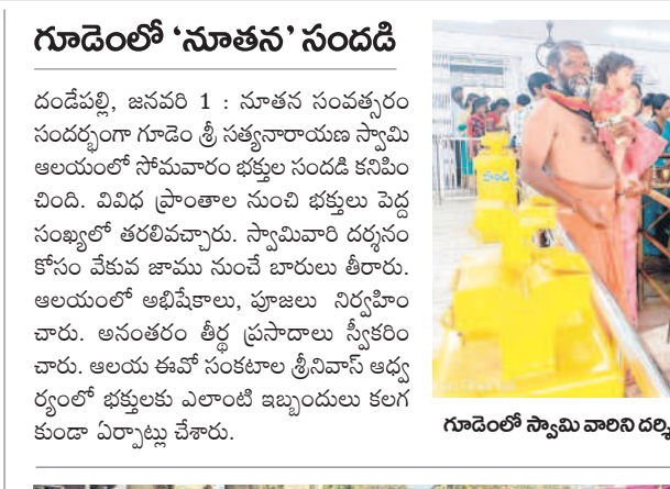
గూడెంలో స్వామి వారిని దర్శించుకుంటున్న భక్తులు