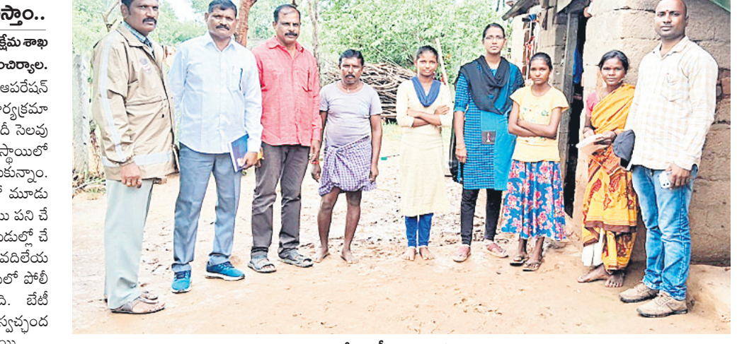
మంచెర్యాలలో తనిఖీలు నిర్వహిస్తున్న అధికారులు

మంచెర్యాల, జనవరి 1 (నమస్తే తెలంగాణ ప్రతినీడి) : కేసీఆర్ ప్రభుత్వం 2017 సంవత్సరంలో ఆపరేషన్ ముస్కాన్ కార్యక్రమాన్ని తీసుకొచ్చింది. యెడాదికి రెండు (జనవరి, జూలై) సార్లు బాల కార్మికులను గుర్తిస్తున్నారు. ఈ రెండు నెలలలోపాటు ప్రత్యేక బృందాలు కూడా పిల్లలను గుర్తించి విముక్తి కల్పిస్తున్నాయి. ప్రతి నియోజకవర్గానికి ఒక బృందం పని చేస్తుండగా.. ప్రతి టీమ్లో ఒక ఎసిఐ, నలుగురు కానిస్టేబుళ్లు, ఒక స్ట్రీట్, శిశు సంక్షేమ శాఖ అధికారి, ఒక కార్మిక శాఖ అధికారి మొత్తం ఏడుగురు ఉన్నారు. వీరు పనులు చేసే పిల్లలను గుర్తించడం, వారి తల్లిదండ్రులకు కొన్నిటింగ్ ఇచ్చి పిల్లలు చదువుకునిలా చేయడం, అనాథ పిల్లలను చేరదీసి చదివించేలా చర్యలు తీసుకోవడం చేస్తున్నారు.