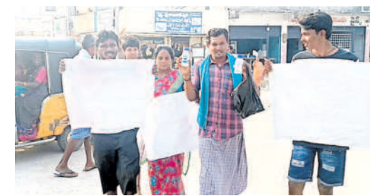
దమ్మన్న పేట నుండి పాదయాత్రగా రాజాకు వస్తున్న బాధితు కుటుంబం