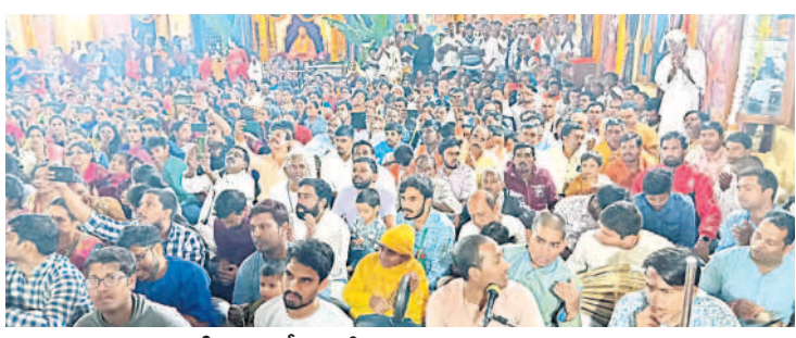
మెట్టపల్లి రూరల్: హారేకృష్ణ సంకీర్తనలో పాల్గొన్న భక్తులు