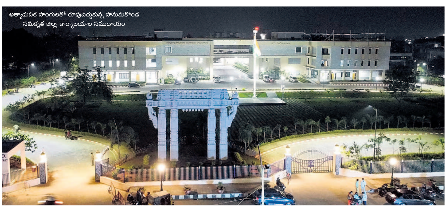
అత్యాధునిక హంగులతో రూపుదిద్దుకున్న హనుమకొండ సమీకృత జిల్లా కార్యాలయాల సముదాయం