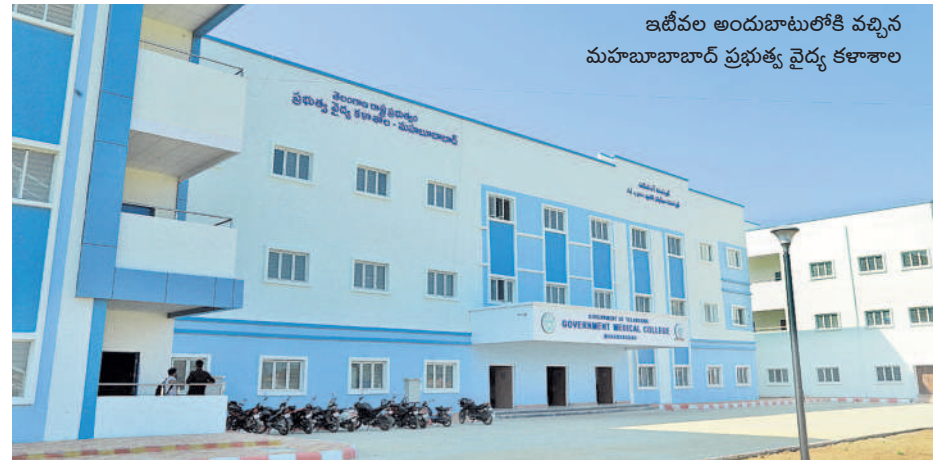
ఇటీవల అందుబాటులోకి వచ్చిన మహబూబాబాద్ ప్రభుత్వ వైద్య కళాశాల

అధికారుల పర్యవేక్షణ పెరిగింది.. వర్షాపేట, అక్టోబర్ 10 : చిన్న జిల్లాల ఏర్పాటుతో నిత్యం ఉన్నతాధికారులు అందుబాటులో ఉంటున్నారు. ప్రజలు వారి సమస్యలను త్వరితగతిన అధికారుల దృష్టికి తీసుకువెళ్లి పరిష్కరించుకుంటున్నారు. మండల కేంద్రాలు, గ్రామాలను సందర్శించి అభివృద్ధి, సంక్షేమ పథకాలపై పర్యవేక్షణ సులభమైంది. రాష్ట్ర ప్రభుత్వం వర్షాపేటను మున్సిపాలిటీగా అప్ గ్రేడ్ చేసి కోట్లాది రూపాయలతో అభివృద్ధి చేసింది. సీఎం కేసీఆర్ చిన్న జిల్లాల ఏర్పాటు చేయడం వల్ల ఇది సాధ్యమైంది. దూరదృష్టితో ముఖ్యమంత్రి కేసీఆర్ అలోచనలతో చిన్న జిల్లాలు ప్రగతిపథకం దూసుకుపోతూనే ఉన్నాయి. - సమస్త నిట్వర్క అక్టోబర్ 10