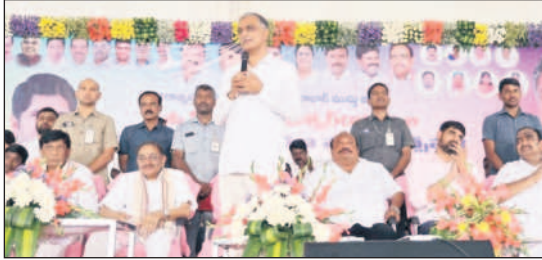
మాట్లాడుతున్న మంత్రి హరీశ్ రావు