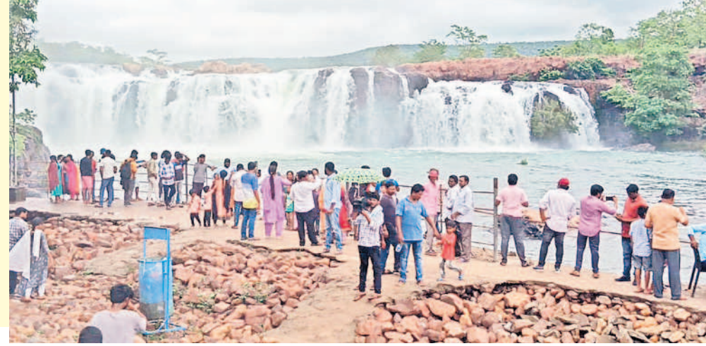
ములుగు జిల్లా వాజేడు మండలం చీకుపల్లి అటవీ ప్రాంతంలో తెలంగాణ నయాగరా బొగతం జలపాతం పాల సురగలా పరవళ్లు తొక్కుతూ జాలువారుతున్నది. పర్యాటకులకు కనువిందు చేస్తున్నది. - వాజేడు, జూలై 22