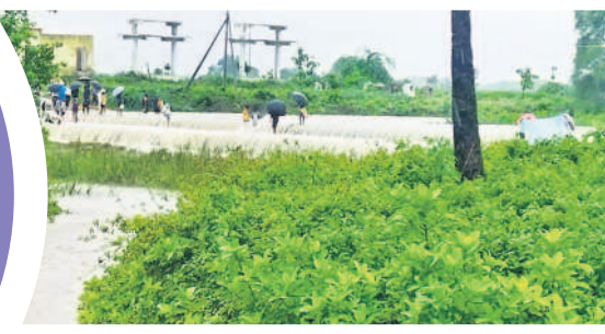
నర్సంపేట రూరల్: మక్రడి మడుతున్న గురిజాల పెద్ద చెరువు