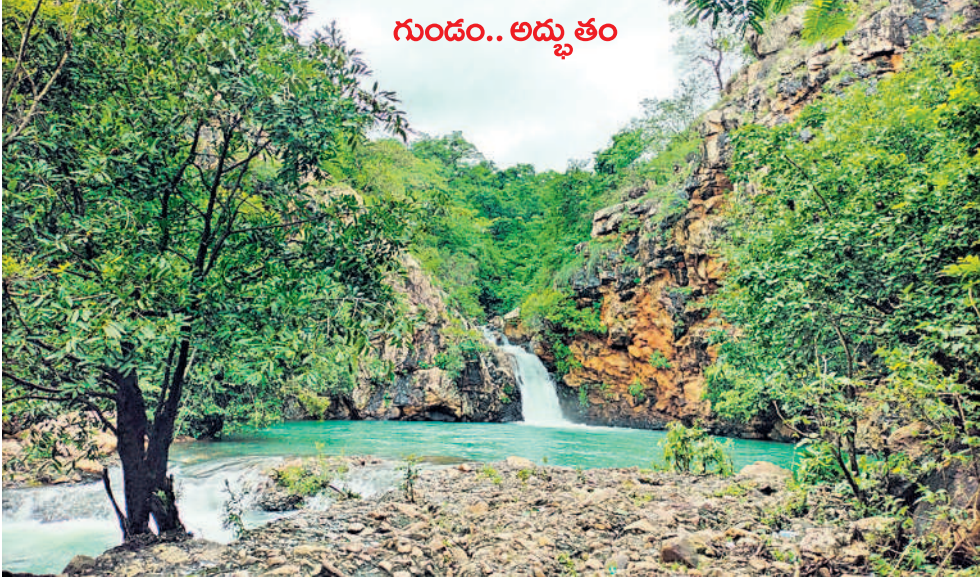
ములుగు జిల్లా వాజేడు మండలం అరుణాచలపురం అటవీ ప్రాంతంలో గుండం జలపాతం రెండు గుట్టల మధ్య నుంచి సన్నని ధారలా జాలువారుతూ ఆకట్టుకుంటున్నది. సెలవు రోజు కావడంతో పెద్ద ఎత్తున పర్యాటకులు తరలివచ్చారు. - వాజేడు, జూలై 22