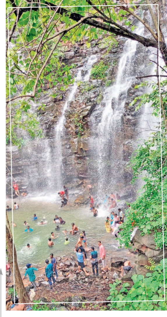
ములుగు జిల్లా వాజేడు మండలం బొల్లారం అటవీ ప్రాంతంలో చిట్టిముత్యాల జలపాతం తెల్లని ముత్యాలు దొర్లినట్లుగా జాలువారుతూ కనువిందు చేస్తున్నది. పర్యాటకులు జలపాతం వద్ద ఫోటోలు దిగుతూ ఎంజాయ్ చేస్తున్నారు. - వాజేడు, జూలై 22