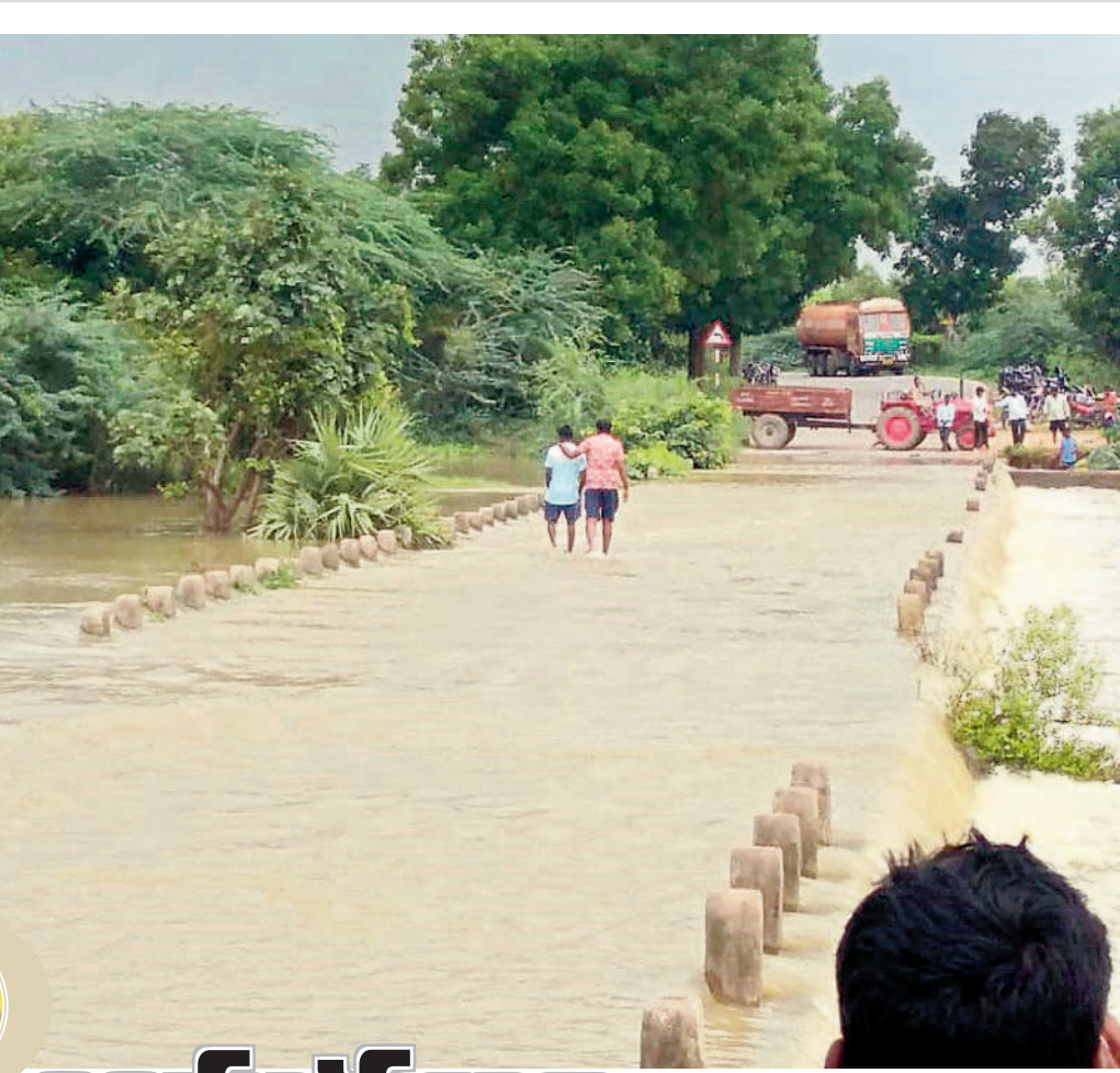
వరద ఉధృతంగా ప్రవహిస్తుండడంతో పట్టణంలో కలెక్టర్ వద్ద నిలిచిన రాకపోకలు