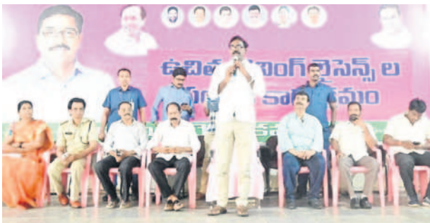
ఉచిత లైసెన్స్ ల పంపిణీలో మాట్లాడుతున్న మంత్రి పువ్వాడ అజయ్

రఘునాథవారి, జూలై 22: ఖమ్మం నియోజకవర్గంలో 18 ఏళ్లు పైబడిన ప్రతి ఒక్కరికీ లైసెన్స్ అందించడమే తన లక్ష్యమని రాష్ట్ర రవాణా శాఖ మంత్రి పువ్వాడ అజయ్ కుమార్ పేర్కొన్నారు. అర్హులైన యువతీ యువకులు, వాహనదారులు ఉచిత లైసెన్స్ అవకాశాన్ని సద్వినియోగం చేసుకోవాలని సూచించారు. లైసెన్స్ ల మేళాలో భాగంగా ఖమ్మంలోని తన క్యాంపు కార్యాలయంలో శనివారం ఏర్పాటు చేసిన కార్యక్రమంలో లబ్ధిదారులకు ఉచిత లైసెన్స్ రిజిస్ట్రేషన్ (ఎల్ఎల్ఆర్) కాపీలను ఆయన పంపిణీ చేసి మాట్లాడారు. ఖమ్మం నియోజకవర్గంలో వాహనాలను కలిగి 10 వేల మంది పైబిలుకు వాహనదారులు, డ్రైవింగ్ వచ్చిన వాళ్లు ఉన్నట్లు ప్రత్యేక సర్వే ద్వారా