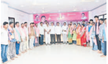
పార్టీలో చేరిన వారితో ప్రభుత్వ విప్ రేగా

సారాపాక, జూలై 22 : తెలంగాణ ప్రభుత్వ పథకాలు దేశానికి ఆదర్శంగా నిలుస్తున్నాయని ప్రభుత్వ విప్ రేగా కాంతారావు పేర్కొన్నారు. ముఖ్యంగా సీఎం కేసీఆర్ అమలు చేస్తున్న సంక్షేమ పథకాలకు అన్ని వర్గాల ప్రజల్లోనూ విశేష ఆదరణ లభిస్తోందని అన్నారు. అందుకే అందరూ వచ్చి బీఆర్ఎస్ లో చేరుతున్నట్లు చెప్పారు. తెలంగాణ ప్రభుత్వ పథకాలకు ఆకర్షణకరమైన చర్యల మండలంలోని వివిధ గ్రామాలకు చెందిన 20 కుటుంబాల వారు శనివారం మునుగురు వచ్చి ఇక్కడి ఎమ్మెల్యే క్యాంపు కార్యాలయంలో ప్రభుత్వ విప్ సమక్షంలో బీఆర్ఎస్ లో చేరారు. ఈ సందర్భంగా వారందరికీ రేగా కాంతారావు గులాబీ కండువలు కప్పి పార్టీలోకి సాదరంగా ఆహ్వానించారు. అనంతరం ఆయన