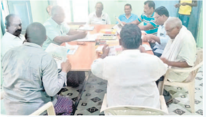
గంగారంలో పత్రికలు, పుస్తకాలు చదువుతున్న గ్రామస్థులు

లను అందుబాటులోకి తెప్పించేందుకు తెలంగాణ ప్రభుత్వం, జిల్లా గ్రంథాలయ సంస్థ శ్రీకారం చుట్టాయి. 'పౌర పఠన మందిరాల' పేరిట వీటిని ఏర్పాటు చేస్తున్నారు. రాష్ట్ర అవతరణ దశాబ్ది వేడుకల్లో భాగంగా ఖమ్మం జిల్లాలోని పలు పంచాయతీల్లో వీటిని ప్రారంభించాయి. పల్లె ప్రజల్లో పఠనాశ్రమి పెంచేందుకు, విద్యార్థులకు, ఉద్యోగార్థులకు ఉపయుక్తంగా ఉండేందుకు వీటి ఏర్పాటును ప్రారంభించాయి. గ్రామాల్లో నిరుపయోగంగా ఉన్న భవనాలకు మరమ్మతులు చేయించి పౌర పఠన మందిరాలుగా మార్చివేయాలని వినియోగిస్తున్నారు. వీటి ఏర్పాటు కోసం రాష్ట్ర ప్రభుత్వం రూ.1.50 లక్షల నిధులు కేటాయించింది. ఈ నిధులతో అందమైన, ఆకర్షణీయమైన భవనాలుగా రూపుదిద్దుకోంది. ఇప్పటికే ఖమ్మం జిల్లాలో 18 చోట్ల వీటిని ప్రారంభించింది. వాటిల్లో ముందుగా మండలానికి రెండు గ్రామ పంచాయతీల్లో ఏర్పాటు చేయాలని భావిస్తోంది. క్రమంగా అన్ని గ్రామాలకూ విస్తరించనుంది. ఈ పౌర పఠన మందిరాల నిర్వహణకు రూ.2 వేలు కేటాయిస్తోంది. వీటిలో రూ.1000 దినపత్రికల కోసం, మరో రూ.1000 గ్రంథాలయ నిర్మాణానికి పాఠికోత్సాహం కోసం వెచ్చించనుంది. పౌర పఠన మందిరాలు నిరుద్యోగ యువతకు, పుస్తక ప్రేమలకు విజ్ఞానాన్ని అందిస్తాయి. వివిధ పోటీ పరీక్షలకు సన్నద్ధమయ్యే నిరుద్యోగులు కోసం పుస్తకాలను తెప్పించి అందుబాటులో ఉంచుతారు. పుస్తక పఠనంపై ఆసక్తి ఉన్నవారు కూడా పచ్చి వివిధ పుస్తకాలు, పత్రికలు చదువుకోవచ్చు. సభ్యత్వం తీసుకున్న వారు అవసరమైన పుస్తకాలను ఇంటికి తీసుకువెళ్లడానికి కూడా వీలుంది.