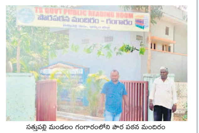
సత్తుపల్లి మండలం గంగారంలోని పౌర పఠన మందిరం