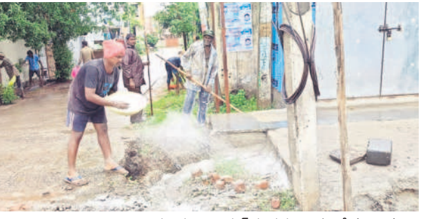
భద్రాచలం టెంపుల్ వరదల ప్రాంతంలో వర్షాల వల్ల వేలం మురుగునీరు శుభ్రం చేస్తున్న పారిశుధ్యకార్మికులు

• భద్రాచలం వద్ద శాంతించిన గోదావరి • పట్టణానికి తప్పిన వరద ముప్పు • ముమ్మరంగా 'క్లినింగ్' పనులు భద్రాద్రి కొత్తగూడెం, జూలై 22 (నమస్తే తెలంగాణ): భద్రాచలం వద్ద గోదావరి శాంతించింది. శనివారం సాయంత్రం ప్రవాహం 40.1 అడుగులకు చేరుకున్నది. కానీ పట్టణాన్ని వరద ప్రభావం మాత్రం వదలలేదు. రాష్ట్ర రవాణాశాఖ మంత్రి అజయ్ కుమార్ శుభ్రవారం నుంచి పట్టణంలోనే మకాం వేసి భద్రాద్రి కలెక్టర్ శ్రీయాంక అలతో కలిసి వరద పరిస్థితులను సమీక్షిస్తున్నారు. సన్నపు నేని మోహన్ జిల్లా పరిషత్ ఉన్నత పాఠశాల పుస్తకాలను కేంద్రంలో ఆక్షయం పొందుతున్న ముంపు ప్రాంతవాసులకు పనులకు కల్పిస్తున్నారు. గతేడాది వానకాలంలో గోదావరి 72.3 అడుగుల వద్ద ప్రవహించి జల ప్రళయం సృష్టించిన సంగతి తెలిసిందే. గత అనుభవాలను దృష్టిలో పెట్టుకుని మంత్రి అజయ్ కుమార్ ఎప్పటికప్పుడు యంత్రాంగాన్ని అప్రమత్తం చేస్తున్నారు. వరద వచ్చి మరలిపోయిన ప్రాంతాల్లో పంచాయతీ సిబ్బంది 440 మందితో పారిశుధ్య చర్యలు చేయిస్తున్నారు. వైద్యారోగ్య శాఖ అధికారులు వైద్యశాలలను నిర్వహించి ప్రజలకు వైద్యపరీక్షలు నిర్వహిస్తున్నారు.