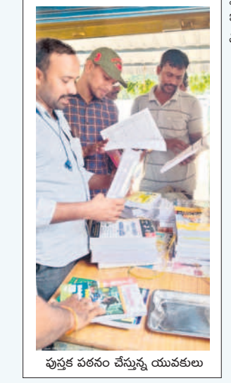
పుస్తక పఠనం చేస్తున్న యువకులు

ఖమ్మం జిల్లాలో గ్రంథాలయ సంస్థ ఆధ్వర్యంలో 18 పౌర పఠన మందిరాలను ఏర్పాటు చేశారు. వీటిలో బోనకల్లు మండలంలోని ముష్టికుట్ల, లక్ష్మీపురం, చింతకాని మండలంలోని ప్రొద్దుటూరు, కొణిజర్ల మండలంలోని మల్లుపల్లి, మానుమంచి మండలంలో గోరీలపాడుతండా, పాపేరు, మధిర మండలంలోని సిరిపురం, ముదిగొండ మండలంలోని మేడిపల్లి, పమ్మి నెలకొండపల్లి మండలంలోని చెరువు మాధారం, పెనుబల్లి మండలంలోని అడవిమల్ల, సత్తుపల్లి మండలంలోని గంగారం, కాకతపల్లి, వేంసూరు మండలంలోని వేంసూరు, చౌడవరం, వైరా మండలంలోని సిరిపురం గ్రామాలు ఉన్నాయి.