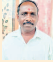
-ఉమ్మడి గోల్లె, విఠోల్, రైతు(ముద్దోల్ మండలం)

ముద్దోల్, జూలై 20 : కాంగ్రెస్ హయాంలో కరెంటు ఎప్పుడు ఉండేదో, ఎప్పుడు పోయేదో తెలియకుండా. దీంతో తిప్పలు వచ్చాయి. మోటారు పెట్టేందుకు రాతుల్లో పోయివచ్చాయి. తెలంగాణ ప్రభుత్వంలో ఆ బాధలు లేవు. 24 గంటల కరెంటుతో రెండు పంటలు తీసుకుంటున్నాం. రాతుల్లో పోయిన పోయి తిప్పలు తప్పాయి. ప్రభుత్వం చేస్తున్న పనులను ఓర్వలేక ఇలాంటి పనులు చేస్తున్నారు. రైతుల జోలికి వస్తే ఊరుకోం.