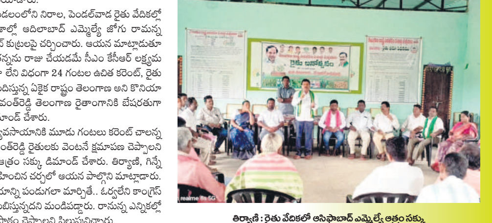
తిర్యగి : రైతు వేదికలో ఆసిఫాబాద్ ఎమ్మెల్యే ఆత్మం సక్కు