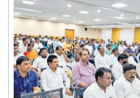
హాజిర్లని లబ్ధిదారులు, ప్రజా తిరిగిధులు

నిర్మల్ పట్టణంలోని గాంధీచౌక్లో ఇన్ని రోజులు మా అన్న దుకాణం పనిజేసిన. నూ అన్ని రకాల గలు తయారీ వచ్చు. ప్రభుత్వం ఇచ్చిన లక్ష రూపాయలతో సొంతంగా బంగారు దుకాణం పెట్టుకుంటు. నేను 10వ తరగతి చదువుతున్న. ఇద్దరు పిల్లలు ఉన్నారు. ఇలా ఒకరి దగ్గర ఎన్ని రోజులు పని చేసుకోవాలి. రేపు పిల్లల భవిష్యత్ ఎట్లా..? అన్న దిగులుండేది. కేసీఆర్ ప్రభుత్వం చేసిన నాయంతో జీవితానికి భరోసా దొరికింది. ఆయనను జీవితం మర్చిపోను. జిల్లాలో మొట్టమొదటి చెక్కు నాకే ఇచ్చారు. ఇది గొప్ప అభ్యుత్సాహ భావిస్తున్న.