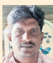
-పండల, గోల్లె, రైతు(ముద్దోల్ మండలం)

ముద్దోల్, జూలై 20 : వ్యవసాయానికి 24 గంటల కరెంటు ఉండేసే రెండు పంటలు చేసుకుంటున్నాం. మూడు గంటల కరెంటుకు మడి కూడా తడవదు. మూడు గంటల కరెంటుతో ఎవరికీ ఉపయోగం ఉండదు. పైనలు ఉన్నక రైతుల బాధలు ఎం తెలుస్తాయి. రైతుల జోలికొస్తే ఊరుకునేది లేదు.