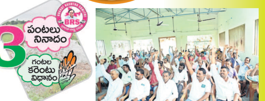
లక్ష్మణ్ణిపేట : కాంగ్రెస్ పార్టీ మొదటి వైఖరిని నిరూపించేందుకు రైతులు