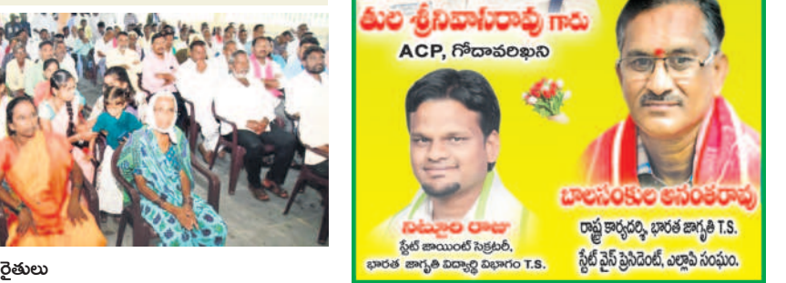
పెగడపల్లి: నందగిరిలో పాల్చిన రైతులు