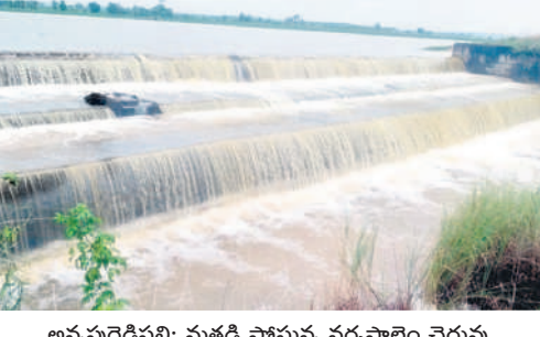
అన్నపురెడ్డిపల్లి: మత్తడి పోస్తున్న నర్సారాం చెరువు