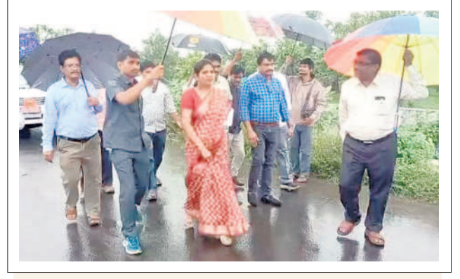
వర్ష: ముంపుగ్రామాల్లో కలెక్టర్ ప్రియాంక ఆల

జిల్లావారా ముందే తెలుసుకోవచ్చు - లావణ్య, గౌతంపూర్, చుంపపల్లి మండలం