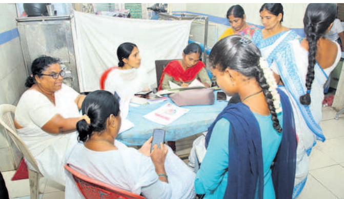
ఆరోగ్య సమస్యలను ఆన్లైన్లో నమోదు చేస్తున్న సిబ్బంది