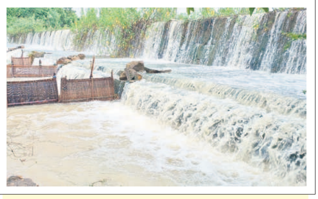
సత్తుపల్లి రూరల్: మత్తడి పోస్తున్న కాకర్లపల్లి ఊరచెరువు