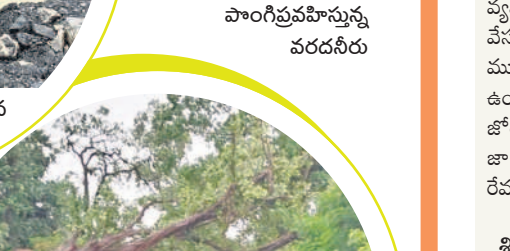
దుమ్మగూడెం మండలం నల్లబెట్టి గ్రామం వద్ద విరిగిపడిన భారీ వృక్షం

వర్షం నగరం మున్నేటిలో చేపలు పడుతున్న దృశ్యం