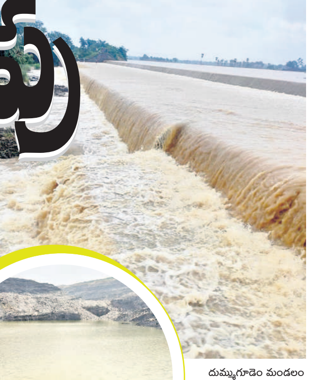
దుమ్మగూడెం మండలం బినగుబ్బలమంగి ప్రాజెక్టులో అలుగు పడి పొంగి ప్రవహిస్తున్న వరదనీరు