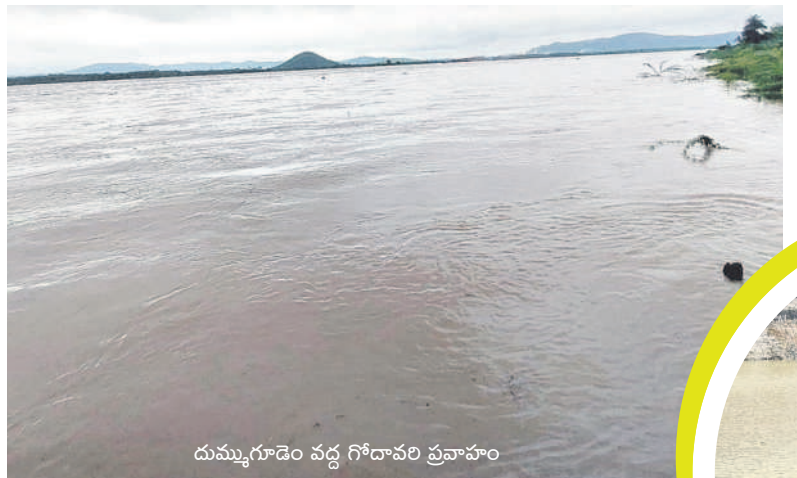
దుమ్మగూడెం వద్ద గోదావరి ప్రవాహం