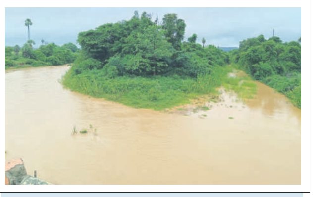
ఆళ్ళపల్లి: మోస్తరుగా ప్రవహిస్తున్న జల్లేరు,కోడెల వారులు