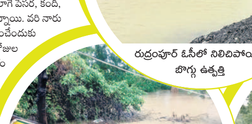
రుద్రంపూర్ ఓసీలో నిలిచిపోయిన బోగ్గూ ఉత్పత్తి

వర్షం, ఇప్పటికే మొలక దశలో ఉన్న పత్తి పంటకు వర్షం ప్రాణం పోసినట్లుంది. అలాగే పెనర, కంది, పెనర పంటలూ ఊపిరిపోసుకోవడాన్ని వరి నారు పోసిన రైతులు ఇక నాట్లు వేయించేందుకు సిద్ధమవుతున్నారు. మరో రెండు రోజుల పాటు భారీ వర్షాలు కురిసే అవకాశం ఉందని వాతావరణ శాస్త్రవేత్తలు ప్రకటించిన నేపథ్యంలో రైతులు అందరికీ తగిన విధంగా ఏర్పాట్లు చేసుకుంటున్నారు. భద్రాద్రి జిల్లాలోని నియోజకవర్గాలలోని కొత్తగూడెం, కిషోర, కలెక్టర్ ప్రాంతం అల పర్యటించారు. స్వయంగా గ్రామాల్లో పర్యటించారు. గోదావరి ముంపు గ్రామాల ప్రజలను అభిమతం చేశారు. కలెక్టర్ వరద పరిస్థితుల సహాయార్థం కొత్తగూడెం లోని కలెక్టరేట్లో ప్రత్యేక కలెక్టర్ రూం ఏర్పాటు చేశారు.