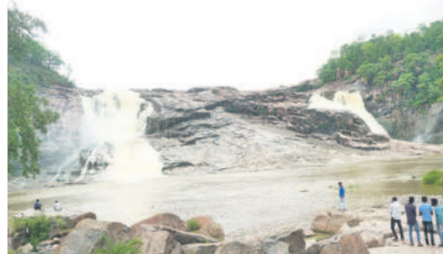
ఆదిలాబాద్ జిల్లాలోని కుంటల జలపాతం