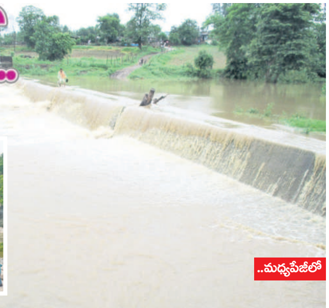
ఇంద్రవెల్లి : మత్తడి దుంకుతున్న జైత్రం తండా శివారులోని చెక్ డ్యాం