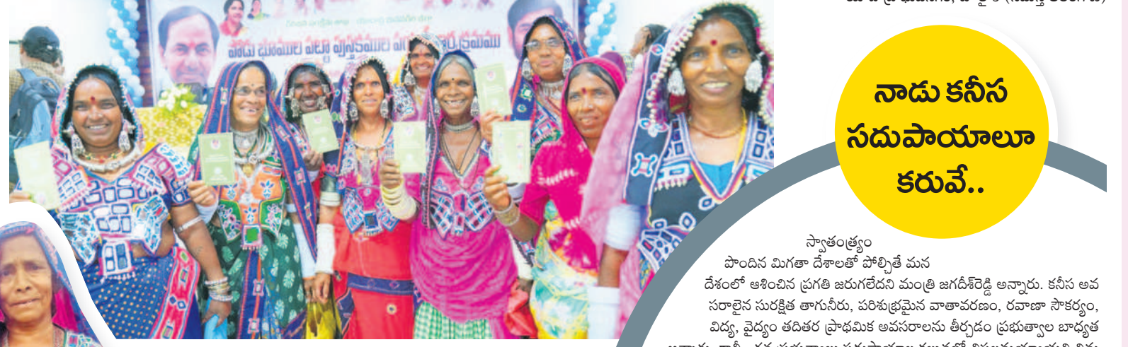
భువనగిరిలో పోడు భూముల పట్టాలతో గిరిజన మహిళల సంబంధం

పోడు కేసుల ఎత్తివేత వ్యవసాయ రంగానికి చేయూతనివ్వాలని 24 గంటల ఉచిత కరెంట్ అందిస్తున్నామని మంత్రి చెప్పారు. ప్రపంచంలో ఎక్కడా లేని విధంగా మూడేండ్లలో రూ. లక్ష కోట్లతో కాళేశ్వరం ప్రాజెక్టు నిర్మించి 50 లక్షల ఎకరాలను సైకికరించారని, సీఎం కేసీఆర్ కు రైతాంగం పట్ల ఉన్న ప్రేమకు ఇదే నిదర్శనమని అన్నారు. గిరిజనులకు 10 శాతం రిజర్వేషన్ అమలు చేశారని తెలిపారు. దేశానికి అన్నం పెట్టే రైతుకు చేయూతనివ్వాలని రైతుబంధు ఇస్తున్నారన్నారు. పోడు భూములకు సంబంధించిన కేసులను ఎత్తివేయాలని సీఎం కేసీఆర్ ఆదేశించారని తెలిపారు. అదవులను పెంపొందించి, పచ్చదనం పెంచాలి, రేపటి తరానికి పరిశుభ్రమైన వాతావరణం కల్పించే దిశగా ప్రజాస్రతిని, అధికారులను క్షేత్ర స్థాయిలో కృషి చేయాలని సూచించారు.