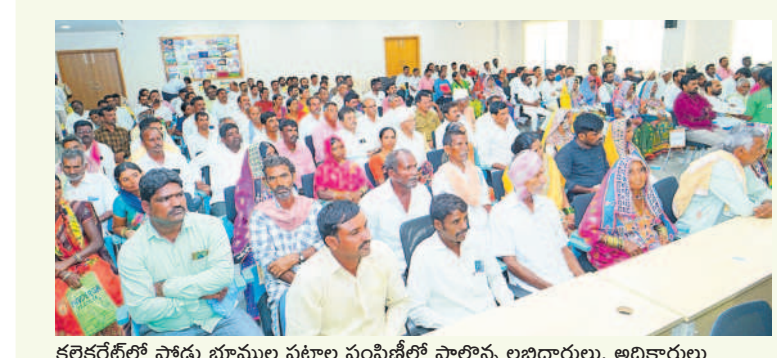
కలెక్టరేట్లో పోడు భూముల పట్టాల పంపిణీలో పాల్గొన్న అధికారులు, అధికారులు