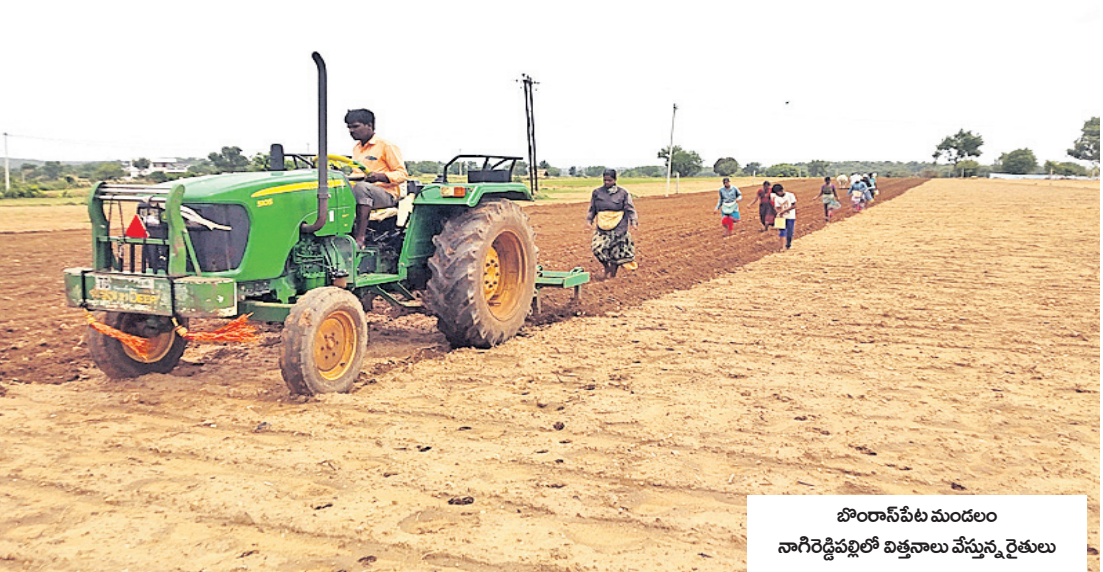
బొంబాయి పంటలం నాగిరెడ్డిపల్లిలో విత్తనాలు వేస్తున్న రైతులు