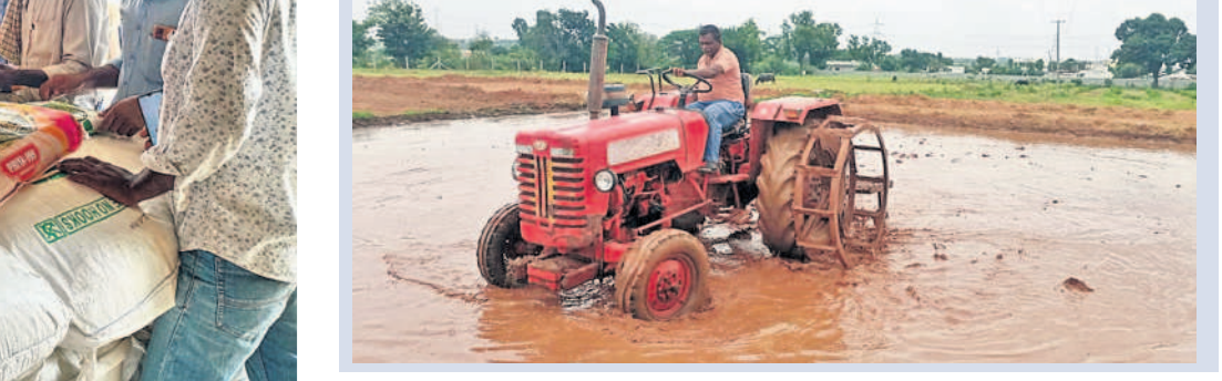
నాగుపల్లి గ్రామంలో వరిసాగుకు సిద్ధం చేస్తూ..