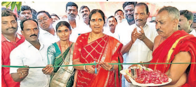
కుర్తివాడలో ఉన్నత పాఠశాల భవనాన్ని ప్రారంభిస్తున్న ఎమ్మెల్యే పద్మాదేవేందర్ రెడ్డి