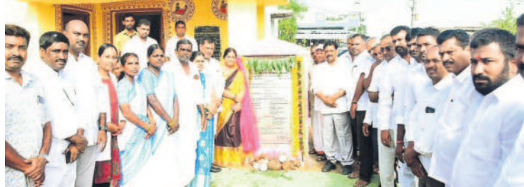
వంకమామిడిలో ఆరోగ్య ఉప కేంద్రం భవనానికి శంకుస్థాపన చేస్తున్న ఎమ్మెల్యే పైళ్ల శేఖరరెడ్డి

భూదాన్ పోచంపల్లి, జూలై 3 : గ్రామీణ ప్రాంతాల అభివృద్ధి బీఆర్ఎస్ ప్రభుత్వ లక్ష్యమని భువనగిరి ఎమ్మెల్యే పైళ్ల శేఖరరెడ్డి అన్నారు. సోమవారం భూదాన్ పోచంపల్లి మండలం పెద్ద గూడెం, ధర్మారెడ్డిపల్లిలో ఒక్కోటి 10 లక్షలతో గౌడ సంఘ భవనం, గ్రామ పంచాయతీ భవనం, జిజ్జక్ పల్లి, వంకమామిడి గ్రామంలో ఒక్కోటి 20 లక్షలతో ఆరోగ్య ఉప కేంద్రాల భవనాలకు ఆయన శంకుస్థాపన చేశారు.