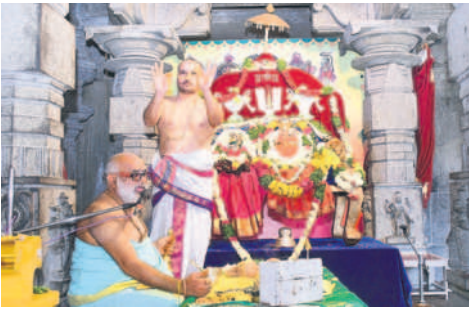
యాదగిరిగుట్టలో స్వామి, అమ్మవార్ల నిత్య తిరుకల్యాణోత్సవం నిర్వహిస్తున్న అర్చకులు

మూర్తులైన స్వామి, అమ్మవార్లను దివ్య మనోహరంగా అలంకరించి గజవాహనంపై వేంచేపు చేసి సేవను కొనసాగించారు. తూర్పునకు అభీష్టంగా స్వామి, అమ్మవార్లను వేంచేపు చేసి నిత్య తిరుకల్యాణోత్సవం జరిపారు. సుమారు గంటన్నరపాటు సాగిన వేడుకల్లో భక్తులు పాల్గొని కల్యాణోత్సవాన్ని తిలకించారు. ఉదయం 3.30 గంటలకు ఆలయాన్ని తెరిచిన అర్చకులు సుప్రభాత సేవతో స్వామివారిని మేల్కొల్పారు. తిరువారాధన జరిపి