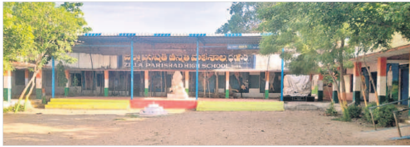
ధర్మార జిల్లా పరిషత్ బాలికల ఉన్నత పాఠశాల

ధర్మార, జూలై 3 : ప్రభుత్వం విద్యార్థులకు పెద్ద పీట వేసింది. ఇందులో భాగంగా ప్రతి పాఠశాలలో మౌలిక వసతులు, సకల సౌకర్యాలు కల్పించింది. డిజిటల్ విద్యారోధన, స్ట్రాక్ ఖాసుల నిర్వహణ, నిష్కాశులైన ఉపాధ్యాయులతో బోధన, కొత్త భవనాలతో బడుల రూపు మారింది. ఇంగ్లీష్ మీడియంతోపాటు ఉచితంగా యూనిఫాం, పాఠ్య, నోట్ పుస్తకాలు అందజేస్తున్నది. మన ఊరు-మనబడి, మన బస్-మన బడి కార్యక్రమం