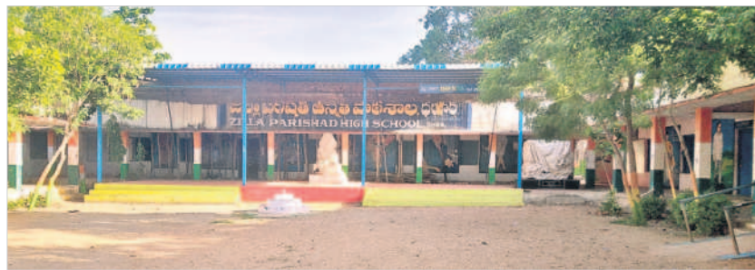
ధర్మార్ జిల్లా పరిషత్ బాలికల ఉన్నత పాఠశాల

ధర్మార్, జూలై 3 : ప్రభుత్వం విద్యార్థులకు పెద్ద పీట వేసింది. ఇందులో భాగంగా ప్రతి పాఠశాలలో మౌలిక వసతులు, సకల సౌకర్యాల కల్పించింది. డిజిటల్ విద్యార్థి ధన, స్టార్ట్ క్లాసుల నిర్వహణ, నిష్కాశులైన ఉపాధ్యాయులతో బోధన, కొత్త భవనాలతో బడుల రూపు మారింది. ఇంగ్లీష్ మీడియంతో పాటు ఉచితంగా యూనిఫాం, పాఠ్య, నోట్ పుస్తకాలు అందజేస్తున్నది. మన ఊరు-మనబడి, మన బస్-మన బడి కార్యక్రమం