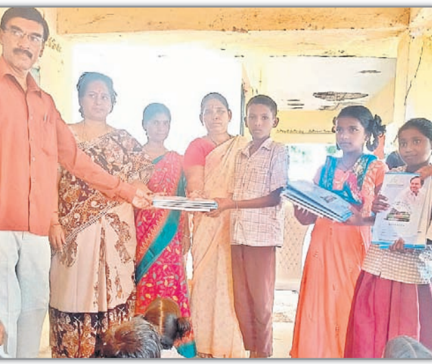
విద్యార్థులకు నోట్ల పుస్తకాలను అందజేస్తున్న ఉపాధ్యాయులు

టన్నుల ఎరువులు అవసరమవుతాయని అంచనా వేసి నట్లు జిల్లా వ్యవసాయాఖ అధికారి వెంకటేశ్ తెలిపారు. వానకాలానికి 63వేల మెట్రిక్ టన్నుల ఎరువులను అందుబాటులో ఉన్నాయన్నారు. అందులో యూరియా 12,258 మెట్రిక్ టన్నులు, డిపీఓ 5,964 మెట్రిక్ టన్నులు, మ్యూరేట్ ఆఫ్ ఫాస్ఫేట్ 578 మెట్రిక్ టన్నులు, సింగిల్ సూపర్ ఫ్రకారం తెప్పించనున్నారు. 24,069 మెట్రిక్ టన్నులు వివిధ రకాల కాంప్లెక్స్ ఎరువులు అందుబాటులో ఉన్నట్లు డివిజన్ తెలిపారు. రైతుల ఆపకపోతులను ఎరువులు నిలవనలా వస్తూనే ఉంటాయని తెలిపారు.