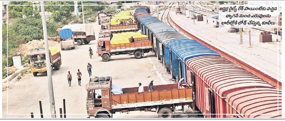
జడ్పర్ రైల్వే రేక్ పాయింట్కు వచ్చిన వ్యాగన్ నుంచి ఎరువులను లాభిలోకి లోడి చేస్తున్న కూలీలు