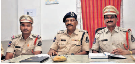
సమావేశంలో మాట్లాడుతున్న మహంకాళి ఏసీపీ రమేశ్

బేగంపేట్ జూలై 13: మహంకాళి బోనాల జాతరను ఈ నెల 9,10న నిర్వహించనున్న నేపథ్యంలో ఉత్సవాలను విజయవంతం చేయాలని మహంకాళి డివిజన్ ఏసీపీ రమేశ్ సూచించారు. సోమవారం పోలీస్ స్టేషన్ నిర్వహించిన సమావేశంలో ఆయన మాట్లాడుతూ అమ్మ వారికి బోనాల సమర్పించే మహిళల కోసం రెండు క్యూటైన్ల ద్వారా అనుమతించనున్నట్లు తెలిపారు. మహిళలు బంగారు ఆభరణాల పట్ల జాగ్రత్తగా ఉండాలని తెలిపారు. బోనాల సమర్పించే మహిళలు చెప్పులను ఆలయానికి దూరంగా పెట్టుకొని రావాలని సూచించారు. జాతరలో పటిష్ట బందోబస్తు ఏర్పాటు చేయనున్నట్లు తెలిపారు. ఆలయ పరిసరాల్లో 114 సీసీ కెమెరాలను ఏర్పాటు చేసినట్లు పేర్కొన్నారు. జాతర కవర్ చేసే ప్రింట్, అండ్ ఎలక్ట్రానిక్ మీడియా ప్రతినిధులు ఐడీ కార్డులను సమర్పించి మీడియా పాసులను పొందాలని సూచించారు. కార్యక్రమంలో ఇన్స్పెక్టర్ కావేటి శ్రీనివాస్ తదితరులు పాల్గొన్నారు.