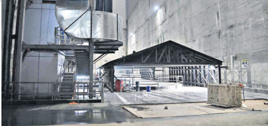
గౌరవెల్లి పంప్ హౌస్ లోని మోటర్లు