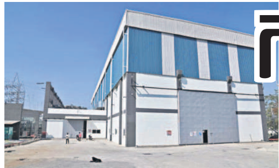
గౌరవెల్లిలోని సర్టిఫైడ్, సంవహాస్