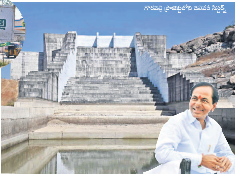
గౌరవెల్లి ప్రాజెక్టులోని డెలివరీ సిస్టర్స్