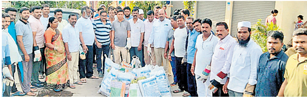
సిద్దిపేట పట్టణంలోని వార్డుల్లో సేకరించిన చెత్తను చూపుతున్న ప్రజాప్రతినిధులు, అధికారులు

వార్డుల్లోని ప్రజలకు చెత్త ఆరుబయట పడేయడంతో కలిగే అనర్థాల గురించి వివరంగా చెత్త సేకరణ వానానాలతో అందించాలని అవగాహన కల్పించారు. కార్యక్రమంలో మున్సిపల్ సిబ్బంది, వార్డు ప్రజలు పాల్గొన్నారు.