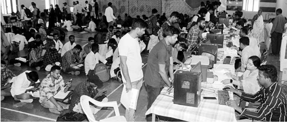
సర్టిఫికేట్ పరిశీలనకు హాజరైన పోలీస్ ఎస్సై, కానిస్టేబుల్ అభ్యర్థులు