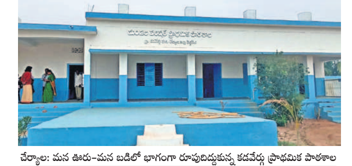
చేర్యాల: మన ఊరు-మన బడిలో భాగంగా రూపుదిద్దుకున్న కడవేర్ల ప్రాథమిక పాఠశాల