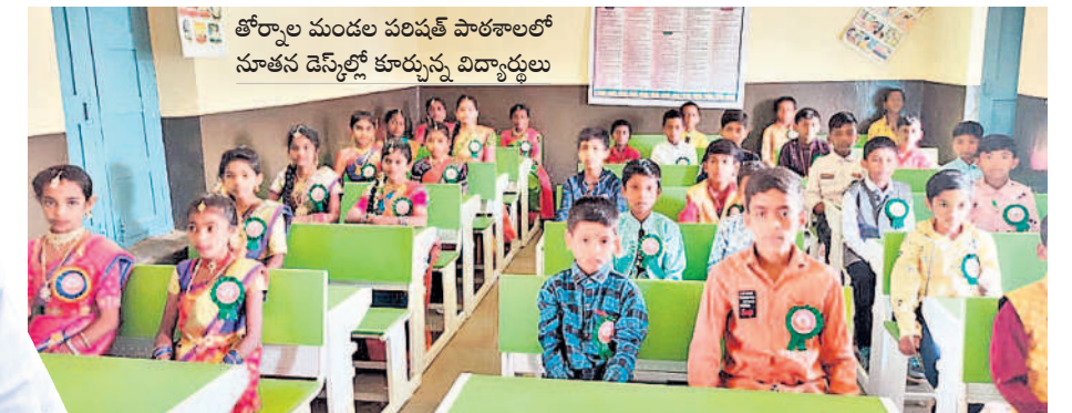
తోర్నాల మండల పరిషత్ పాఠశాలలో నూతన డెస్కుల్లో కూర్చున్న విద్యార్థులు

కార్వారేట్లను తలదన్నేలా ప్రభుత్వ పాఠశాలలు సిద్దిపేట రూరల్, జూన్ 19: కార్వారేట్ పాఠశాలలకు ఏ మాత్రం తీసిపోకుండా ప్రభుత్వ స్కూళ్ల సకల వసతులతో కొత్తరూపు సంతరించుకున్నాయి. సిద్దిపేట రూరల్ మండలంలోని తోర్నాల, చింతమడక, రామవార్యూర్ పాఠశాలలు మన ఊరు-మన బడిలో భాగంగా ప్రభుత్వం చేపట్టిన పనులతో మెరుగుపడ్డాయి. దీంతో విద్యార్థుల ప్రవేశాలు పెరుగుతున్నాయి.