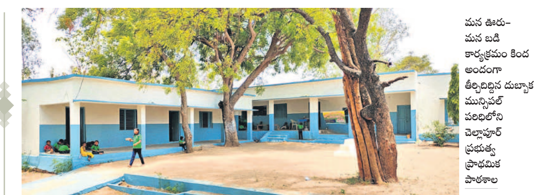
మన ఊరు-మన బడి కార్యక్రమం కింద అందంగా తీర్చిదిద్దిన దుబ్బాక మున్సిపల్ పరిషత్లోని చెల్లూర్ ప్రభుత్వ ప్రాథమిక పాఠశాల

తెలంగాణ రాష్ట్ర అవతరణ దశాబ్ది ఉత్సవాల్లో భాగంగా సిద్దిపేట జిల్లా కేంద్రంలోని పోలీస్ కన్వెన్షన్ హాల్లో మంగళవారం విద్యా దినోత్సవాన్ని నిర్వహిస్తున్నారు. ఈ మేరకు అధికారులు అన్ని ఏర్పాట్లు పూర్తి చేశారు. విద్యా దినోత్సవంలో భాగంగా జిల్లా వ్యాప్తంగా మన ఊరు-మన బడి కార్యక్రమం ద్వారా 100 శాతం పనులు పూర్తి చేసుకున్న 32 పాఠశాలలను ప్రారంభానికి సిద్ధం చేశారు. అదే విధంగా ఆయా పాఠశాలల్లో సిద్ధం ఉన్న గ్రంథాలయాల, డిజిటల్ క్లాస్ రూమాలను సైతం ప్రారంభించనున్నారు. అన్ని పాఠశాలలను మామిడి తోరణాలు, పూలతో అందంగా అలంకరించారు. టెన్స్ పరీక్షా ఫలితాల్లో వంద శాతం పొందిన ప్రభుత్వ పాఠశాలలకు, 10 జీసీపీ సాధించిన విద్యార్థులకు నగదు బహుమతి అందించనున్నట్లు అధికారులు తెలిపారు.