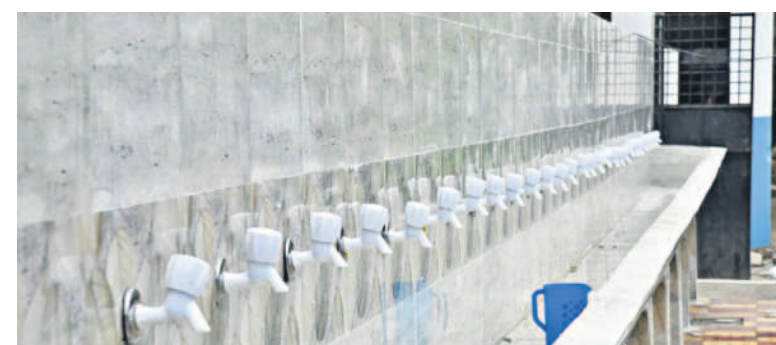
సిద్దిపేట పట్టణంలోని బాలికల ప్రాథమిక పాఠశాలలో నూతనంగా ఏర్పాటు చేసిన నల్లాయి