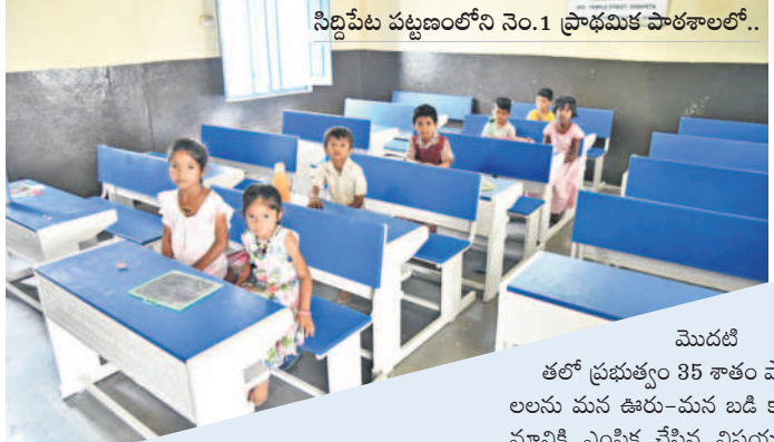
సిద్దిపేట పట్టణంలోని నెం.1 ప్రాథమిక పాఠశాలలో..

సిద్దిపేట అర్బన్, జూన్ 19: నాడు సర్కారు బడులంటే అరకొర వసతులు.. ఇరుకైన తరగతి గదులు.. శిబిలావస్తలో ఉన్న భవనాలు దర్శనమిచ్చేవి. కానీ నేడు ప్రభుత్వ పాఠశాలల్లో చదివే విద్యార్థులకు నాణ్యమైన విద్యను అందించడమే లక్ష్యంగా తెలంగాణ రాష్ట్ర ప్రభుత్వం అత్యంత ప్రతిష్టాత్మకంగా మన ఊరు-మన బడి కార్యక్రమం ద్వారా వసతుల కల్పనకు శ్రీకారం చుట్టింది. కార్వారేట్ పాఠశాలలకు దీటుగా ప్రభుత్వ పాఠశాలలను రాష్ట్ర ప్రభుత్వం తీర్చిదిద్దుతుంది. ప్రభుత్వ పాఠశాలల్లో సకల సౌలభ్యం కల్పించి.. నాణ్యమైన విద్యను అందించడంతో.. గత రెండు సంవత్సరాలుగా మెరుగైన ఫలితాలు వస్తున్నాయి. ఉత్తీర్ణత శాతంలో పదోతరగతి ఫలితాల్లో జిల్లా మొదటి, రెండో స్థానంలో నిలిచింది. 2022 పది ఫలితాల్లో జిల్లా రాష్ట్రంలోనే మొదటి స్థానంలో నిలువగా... ఈ సంవత్సరం కొద్దిపాటి తేడాతో రెండో స్థానంలో ఉండడం విశేషం. మన ఊరు-మన బడి కార్యక్రమంలో భాగంగా మొత్తం 12 రకాల మౌలిక సదుపాయాలు కల్పించారు. జిల్లాలో మొత్తం 976 ప్రభుత్వ పాఠశాలలకు 343 పాఠశాలలను మొదటి విడతలో ఎంపిజేసీ చేసింది. ఈ మేరకు జిల్లాలో 100కు పైగా పాఠశాలల్లో 90 శాతం పైగా పనులు పూర్తి చేసుకొని ప్రారంభానికి సిద్ధంగా ఉన్నాయని విద్యాశాఖ అధికారులు వెల్లడించారు.