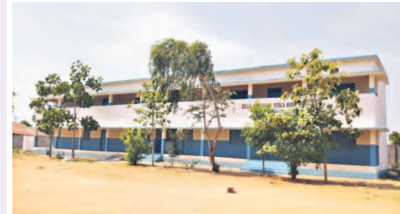
మన ఊరు-మన బడిలో భాగంగా అందంగా రూపుదిద్దుకున్న మిరుదొడ్డి జిడ్డి పాఠశాల