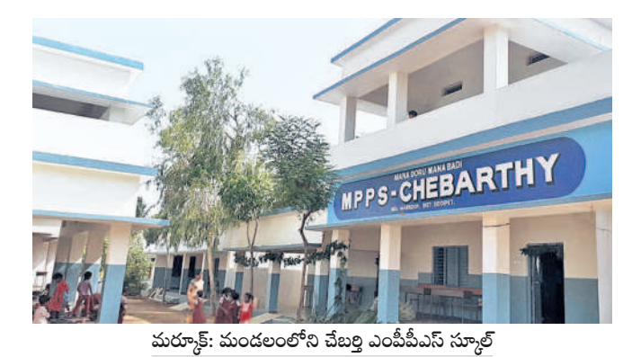
మరూళ్: మండలంలోని చేబర్తి ఎంపిజేసీ సూట్