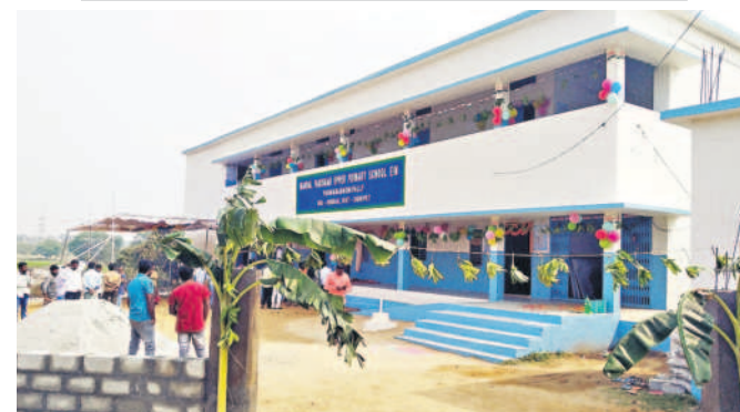
దుబ్బాక: పద్మాభయనిపల్లిలో నిర్మించిన ప్రాథమిక స్కూల్ పాఠశాల

సిద్దిపేట అర్బన్, జూన్ 19: నాడు సర్కారు బడులంటే అరకొర వసతులు.. ఇరుకైన తరగతి గదులు.. శిబిలావస్తలో ఉన్న భవనాలు దర్శనమిచ్చేవి. కానీ నేడు ప్రభుత్వ పాఠశాలల్లో చదివే విద్యార్థులకు నాణ్యమైన విద్యను అందించడమే లక్ష్యంగా తెలంగాణ రాష్ట్ర ప్రభుత్వం అత్యంత ప్రతిష్టాత్మకంగా మన ఊరు-మన బడి కార్యక్రమం ద్వారా వసతుల కల్పనకు శ్రీకారం చుట్టింది. కార్వారేట్ పాఠశాలలకు దీటుగా ప్రభుత్వ పాఠశాలలను రాష్ట్ర ప్రభుత్వం తీర్చిదిద్దుతుంది. ప్రభుత్వ పాఠశాలల్లో సకల సౌలభ్యం కల్పించి.. నాణ్యమైన విద్యను అందించడంతో.. గత రెండు సంవత్సరాలుగా మెరుగైన ఫలితాలు వస్తున్నాయి. ఉత్తీర్ణత శాతంలో పదోతరగతి ఫలితాల్లో జిల్లా మొదటి, రెండో స్థానంలో నిలిచింది. 2022 పది ఫలితాల్లో జిల్లా రాష్ట్రంలోనే మొదటి స్థానంలో నిలువగా... ఈ సంవత్సరం కొద్దిపాటి తేడాతో రెండో స్థానంలో ఉండడం విశేషం. మన ఊరు-మన బడి కార్యక్రమంలో భాగంగా మొత్తం 12 రకాల మౌలిక సదుపాయాలు కల్పించారు. జిల్లాలో మొత్తం 976 ప్రభుత్వ పాఠశాలలకు 343 పాఠశాలలను మొదటి విడతలో ఎంపిజేసీ చేసింది. ఈ మేరకు జిల్లాలో 100కు పైగా పాఠశాలల్లో 90 శాతం పైగా పనులు పూర్తి చేసుకొని ప్రారంభానికి సిద్ధంగా ఉన్నాయని విద్యాశాఖ అధికారులు వెల్లడించారు.