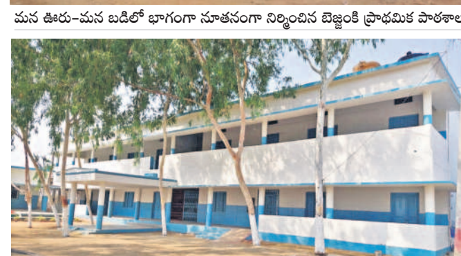
రాయపాటి: కార్వారేట్లకు దీటుగా వడ్డేపల్లి జిల్లా పరిషత్ ఉన్నత పాఠశాల