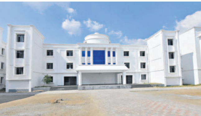
దుబ్బాక: కార్వారేట్లకు దీటుగా దుబ్బాకలోని జిల్లా పరిషత్ ఉన్నత పాఠశాల