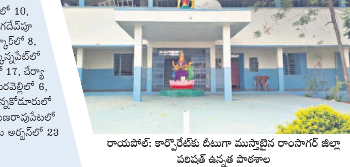
రాయపాటి: కార్వారేట్లకు దీటుగా ముస్తాబైన రాంసాగర్ జిల్లా పరిషత్ ఉన్నత పాఠశాల