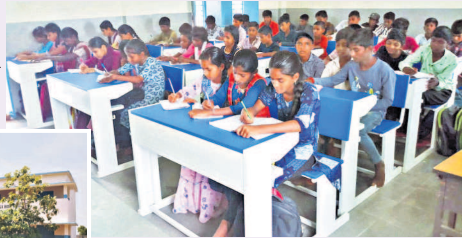
మిరుదొడ్డి జిడ్డి పాఠశాలలో నూతన టేబుల్స్ పై కూర్చున్న విద్యార్థులు