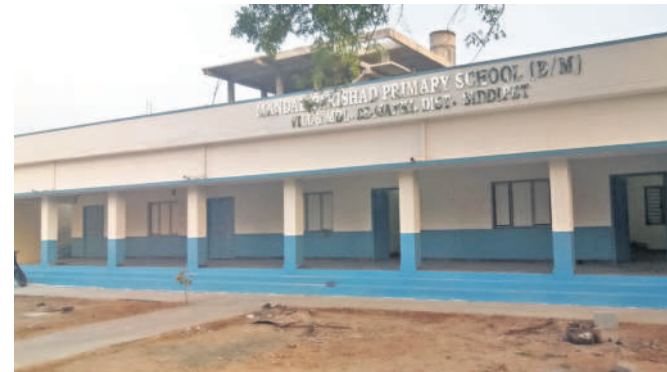
మన ఊరు-మన బడిలో భాగంగా నూతనంగా నిర్మించిన బెజ్జంకి ప్రాథమిక పాఠశాల