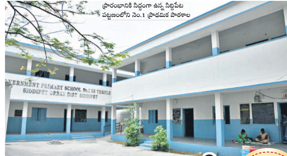
ప్రాచారణానికి సిద్ధంగా ఉన్న సిద్దిపేట పట్టణంలోని నెం.1 ప్రాథమిక పాఠశాల