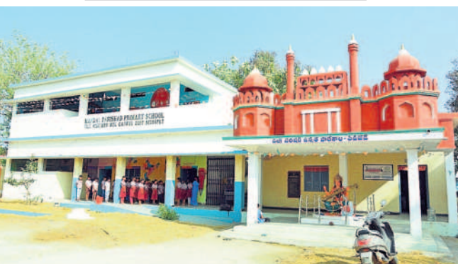
గజ్వేల్: పిడిచెడలో 'మన ఊరు-మన బడి'లో భాగంగా ముస్తాబైన పాఠశాల