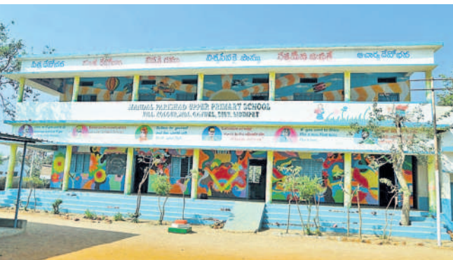
గజ్వేల్: కొల్లూర్లో 'మన ఊరు-మన బడి'లో భాగంగా ముస్తాబైన పాఠశాల

కార్వారేట్లను తలదన్నేలా ప్రభుత్వ పాఠశాలలు సిద్దిపేట రూరల్, జూన్ 19: కార్వారేట్ పాఠశాలలకు ఏ మాత్రం తీసిపోకుండా ప్రభుత్వ స్కూళ్ల సకల వసతులతో కొత్తరూపు సంతరించుకున్నాయి. సిద్దిపేట రూరల్ మండలంలోని తోర్నాల, చింతమడక, రామవార్యూర్ పాఠశాలలు మన ఊరు-మన బడిలో భాగంగా ప్రభుత్వం చేపట్టిన పనులతో మెరుగుపడ్డాయి. దీంతో విద్యార్థుల ప్రవేశాలు పెరుగుతున్నాయి.