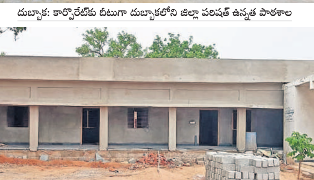
మద్దూరులో తుదిదశకు చేరిన తరగతి గదుల పనులు