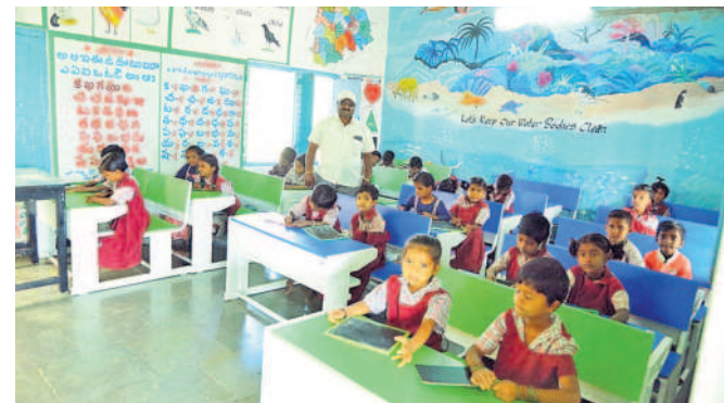
గజ్వేల్: బెజాగామ పాఠశాలలో డిజిటల్ తరగతి గదిలో విద్యార్థులు