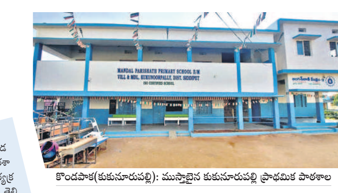
కొండపాక(కుకునూరుపల్లి): ముస్తాబైన కుకునూరుపల్లి ప్రాథమిక పాఠశాల

మన ఊరు-మన బడి కార్యక్రమానికి జిల్లా వ్యాప్తంగా మొదటి విడతలో 343 ప్రభుత్వ పాఠశాలలను విద్యాశాఖ ఎంపిక చేసింది. ఇందులో 186 ప్రైవేట్ పాఠశాలలు ఉండగా, 38 ప్రాథమిక స్కూల్ పాఠశాలలు, 124 ఉన్నత పాఠశాలలు ఉన్నాయి. మొత్తం జిల్లా పరిషత్ 976 ప్రభుత్వ పాఠశాలలు ఉండగా, అందులో 636 ప్రాథమిక పాఠశాలలు, 118 ప్రాథమిక స్కూల్ పాఠశాలలు, 227 ఉన్నత పాఠశాలలు ఉన్నాయి. అయితే మొదటి విడతలో ప్రభుత్వం 35 శాతం పాఠశాలలను మన ఊరు-మన బడి కార్యక్రమానికి ఎంపిక చేసిన విషయం తెలిసింది. ఇందులో దాల్చాబాద్ మండలంలో 12 పాఠశాలలు, దుబ్బాక మండలంలో 25, మిరుదొడ్డిలో 14, రాయపాటిలో 10, తోగుపల్లిలో 14, గజ్వేల్లో 20, జగదేవపూర్లో 15, కొండపాకలో 20, మర్నాకల్లో 8, ములుగుల్లో 14, వద్దల్లో 16, అత్తన్నపేట్లో 22, హుస్సాబాద్లో 10, కోహడల్లో 17, చేర్యాలలో 19, ధూర్మపల్లిలో 5, కొమురచెల్లిలో 6, మద్దూరులో 8, బెజ్జంకిలో 12, చిన్నకోడూరులో 19, నంగునూరులో 18, నారాయణరావుపేటలో 6, సిద్దిపేట రూరల్లో 10, సిద్దిపేట అర్బన్లో 23 పాఠశాలలు ఉన్నాయి.