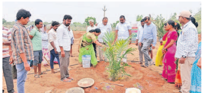
సిద్దిపేటరూరల్ : చిన్నగుండవెల్లిలో మొక్కనాటుతున్న ప్రజాప్రతినిధులు