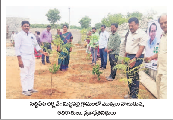
సిద్దిపేట అర్బన్ : మిట్టపల్లి గ్రామంలో మొక్కలు నాటుతున్న అధికారులు, ప్రజాప్రతినిధులు