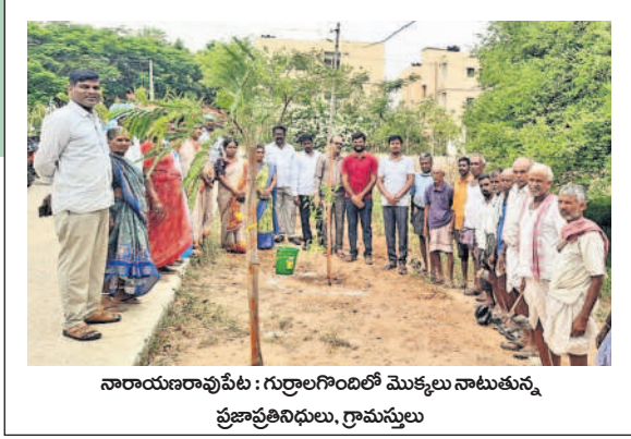
నారాయణరావుపేట : గుర్రాలగొందిలో మొక్కలు నాటుతున్న ప్రజాప్రతినిధులు, గ్రామస్థులు