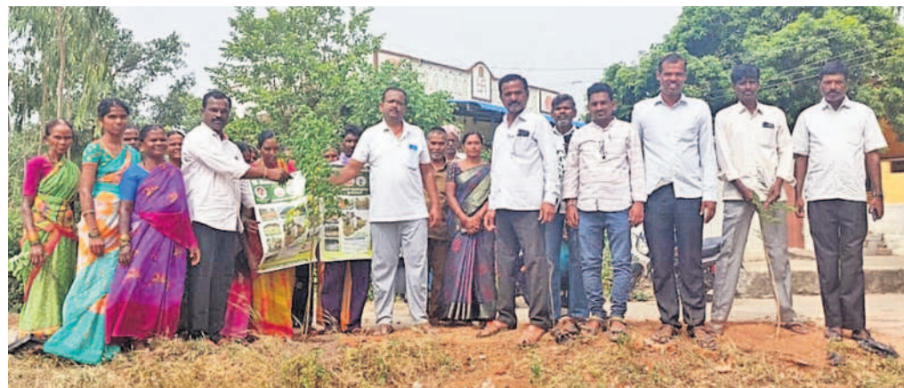
నంగునూరు : బద్దిపడగలో మొక్కలు నాటుతున్న అధికారులు, ప్రజాప్రతినిధులు