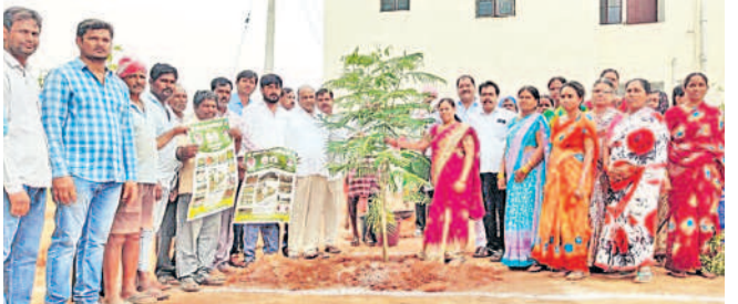
చిన్నకోడూరులో హరితోత్సవంలో మొక్కలు నాటుతున్న ఎంపీపీ కూర మాణిక్యరెడ్డి